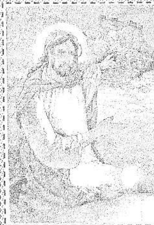
(Vangelo secondo Matteo 5, 13-16)

6/02/11 5° domenica del Tempo ordinario/A