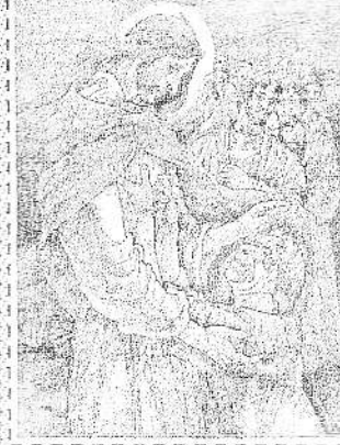
(Vangelo secondo Matteo 4,12-23)

UNA LUCE SIE' LEVATA NELLA GALILEA DELLE GENTI