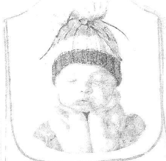
Servo di Dio e nostro