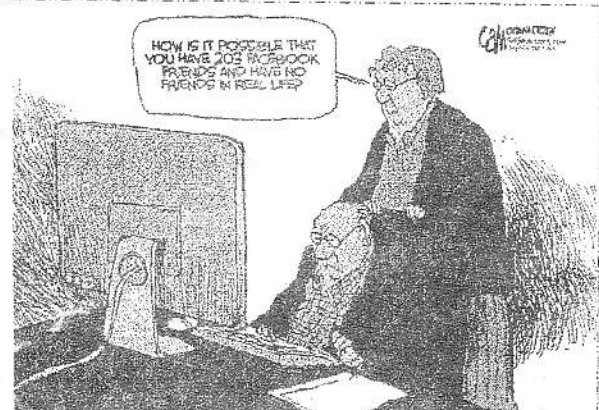
La moglie al marito: «Com'è possibile che tu abbia 203 amici su Facebook e nessuno nella vita reale?» (Cameron Cardow, «The Ottawa Citizen», Canada)