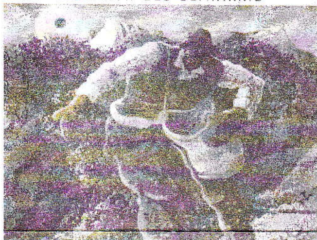
Pregheira per le vocazioni sacerdotali